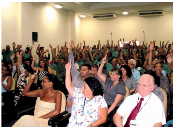
Em assembleia no Arsenal de Marinha, funcionários da Emgepron aprovaram o Acordo

Pelo Acordo, cláusulas anteriores, como o seguro de vida em grupo, foram mantidas. A empresa também se compromete a realizar acompanhamento social e médico do empregado afastado, através de uma junta médica, constituída por médico do trabalho, médico perito e assistente social.